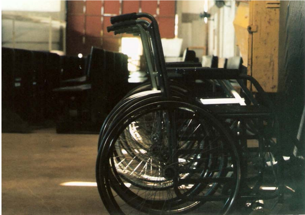
As cadeiras de roda perfiladas oferecem subsídios para se caracterizar uma parcela daqueles que freqüentam a Organização Paracientífica Adolfo Fritz.

O recinto é amplo e possui uma linha de fios com lâmpadas de voltagem extremamente alta proporcionando uma boa iluminação nesse espaço. Por todos os lados podem ser vistos papéis com avisos acerca dos dias das próximas sessões de atendimento. Os portões do galpão ficam sempre fechados, só sendo abertos para o público nos sábados em que o médium atua ou, esporadicamente, para limpeza, por um membro da equipe terrena residente em Rio Novo.